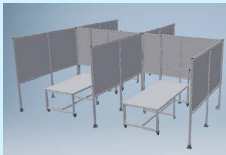
Cubículos de aislamiento