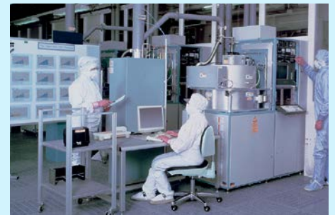
Laboratorios y áreas limpias